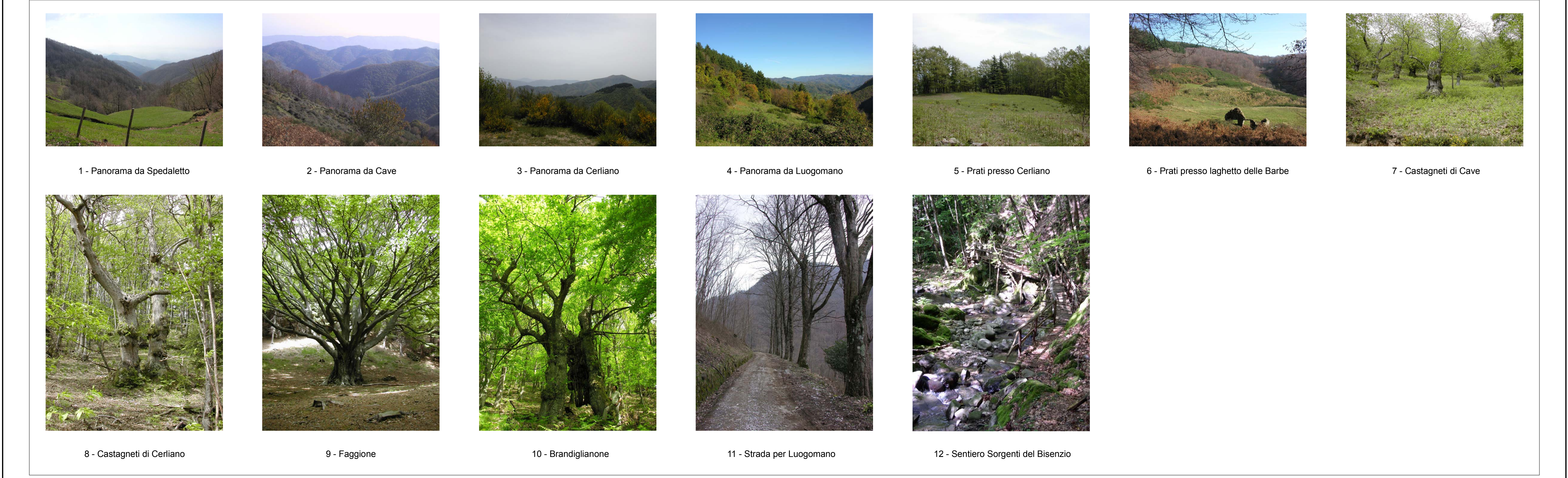
1 - Panorama da Spedaletto